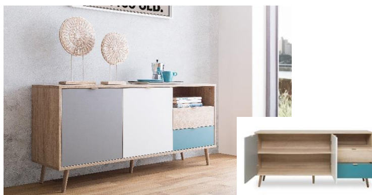
SAPATEIRA 3C Cód. 395196 L170 x A127 x P24 cm