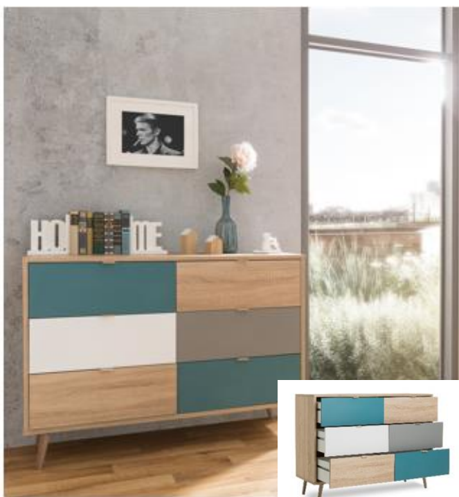
CÓMODA 6 GAVETAS Cód. 395195 L120 x A87 x P40 cm.