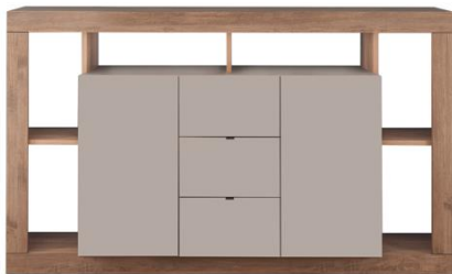
APARADOR 2P 3G L172xA102xP42 cm. Cód. 115904