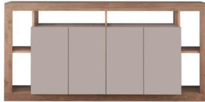
APARADOR 4P L210xA102xP42 cm. Cód. 115903