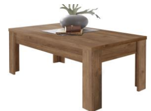
MESA DE CENTRO L122x A45xP64 cm. Cód. 115912