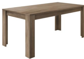
MESA DE JANTAR FIXA L180xA 80xP90 cm Cód. 115911