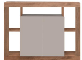
APARADOR 2P L134xA102xP42 cm. Cód. 115906