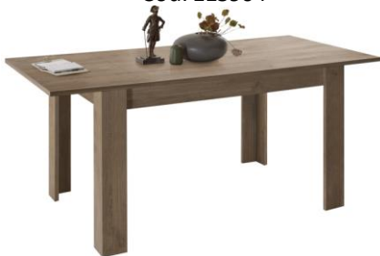
MESA DE JANTAR EXTENSÍVEL L137/186xA80xP90 cm. Cód. 115910