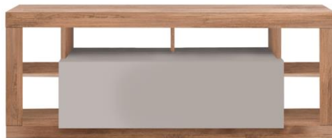
MÓVEL TV L172 xA66xP42 cm. Cód. 115907