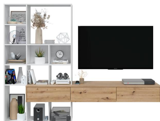
COMPACTO TV 226 L226xA173xP 40 f cm. Cód.: 111387