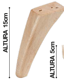
PATA PIRAMIDAL (MÉTRICA 8) 387045