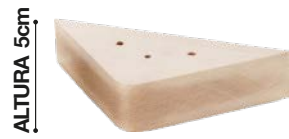
PATA CURVA (MÉTRICA 8) 387043